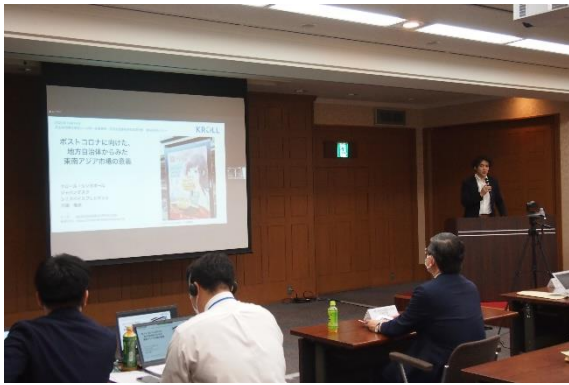
川端様ご講演の様子