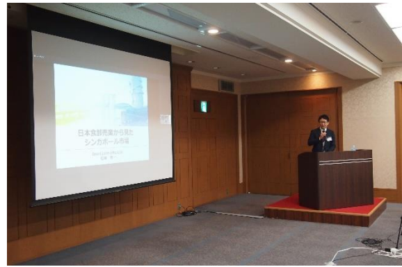
松崎様ご講演の様子