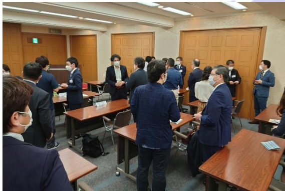
名刺交換会の様子

また、第2部の講演後、会場では名刺交換会と題して、講師への個別質問や今後の相談、参加者同士での情報交換の場を設けたところ、長丁場のセミナー後にもかかわらず、多くの方が活発な議論を交わすとともに、講師や他自治体との新たなネットワークを作っておられました。