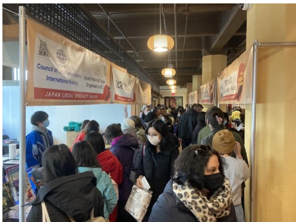
食品展会場の様子(1)