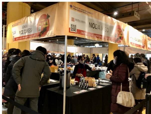
食品展会場の様子(2)