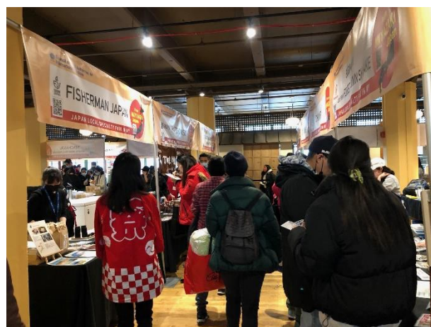
食品展会場の様子(3)