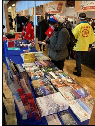
パンフを手にする来場客