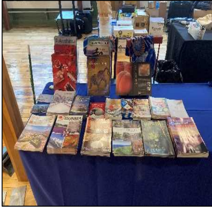
自治体パンフレット（英語版）