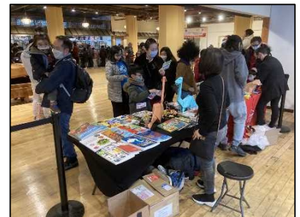
折り紙体験する来場者