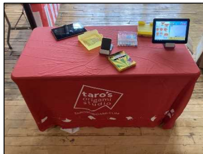
折り紙体験ブース