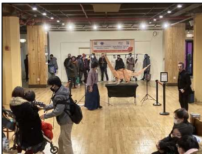
巨大折り紙パフォーマンス

また、事前に現地の折り紙スタジオに依頼し、26日（土）には、巨大折り紙パフォーマンスと折り紙教室を開催しました。週末は家族連れが多かったため、多くの子どもたちが興味津々で参加していました。