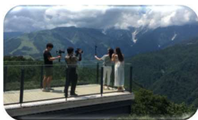
HAKUBA MOUNTAIN HARBOR (長野県)