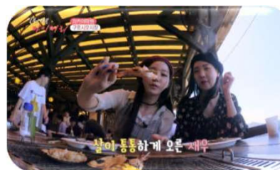
黒潮市場（和歌山県）での撮影風景