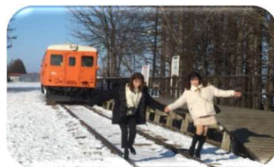
幸福駅（北海道帯広市）