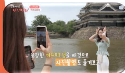
松本城（長野県）での撮影風景