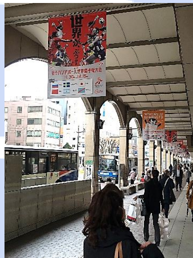
女子ハンドボール世界選手権の タペストリー（熊本市中心部）

その中から今回は、熊本市中心部から車で北に40分ほど離れた場所にある植木温泉地区のインバウンドへの取り組み事例を取り上げ、取材しました。