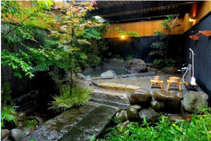
ゆったりと過ごせる植木温泉