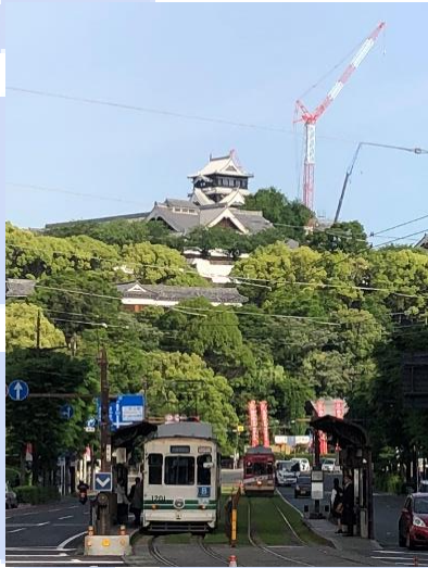
ラグビーワールドカップ熊本会場の 試合日前に特別公開が始まった熊本城

2019年9月から11月に開催されたラグビーワールドカップ2019、12月に熊本県内各地で開催された女子ハンドボール世界選手権大会には、海外からも大会選手や観戦者が熊本を訪れました。この2つの国際スポーツ大会に向けて、熊本市は様々なインバウンド受入整備を進めてきました。