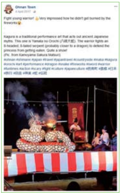
フェイスブックを使った神楽に関する情報発信