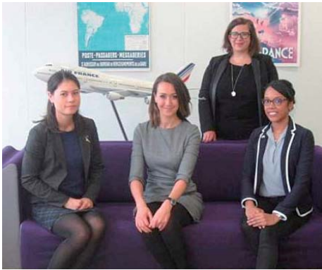
エールフランス航空（パリ）へ出張し、過去の取材の御礼と情報交換を実施（前列右側が CIR）