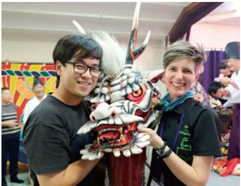
中国からの留学生（左）に神楽体験を案内するアメリカからの CIR