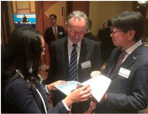
FISA 国際ポート連盟臨時総会（東京）にて、フランスポート連盟にプレゼンする豊岡市長の通訳（手前左が CIR）