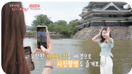
松本城（長野県）での撮影風景