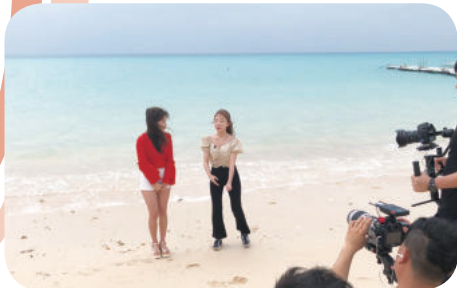
与那覇前浜ビーチ（沖縄県）での撮影風景