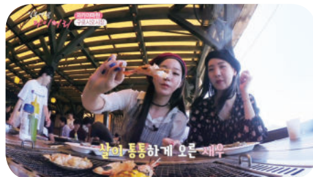
黒潮市場（和歌山県）での撮影風景