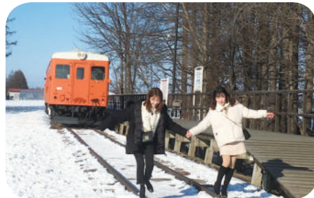
幸福駅（北海道帯広市）