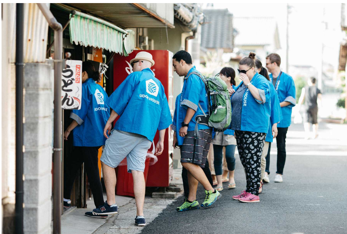
UDON HOUSE 体験の様子