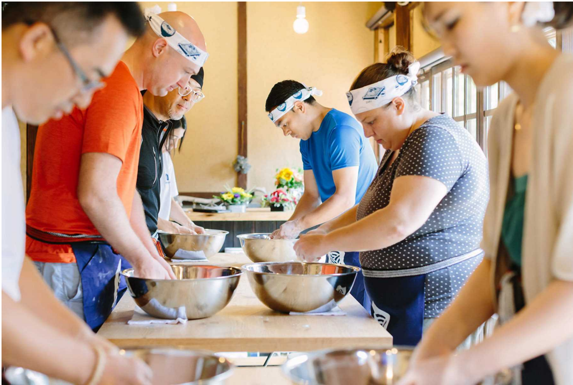
UDON HOUSE 体験の様子