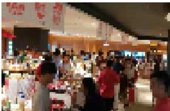
食品展会場の様子(1)