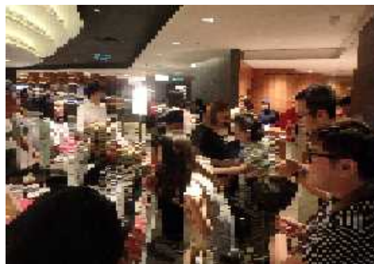
食品展会場の様子(2)