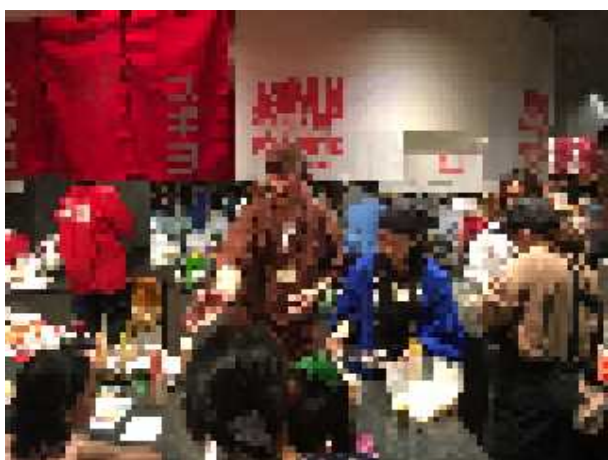
イートインコーナーの様子