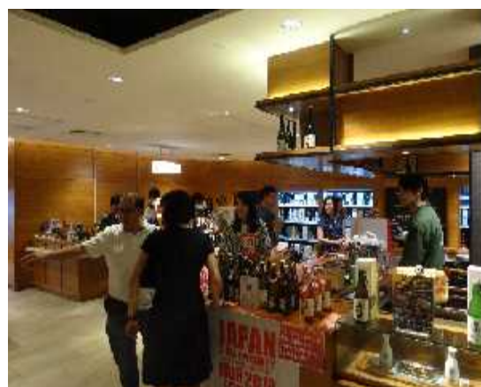
酒類販売コーナーの様子