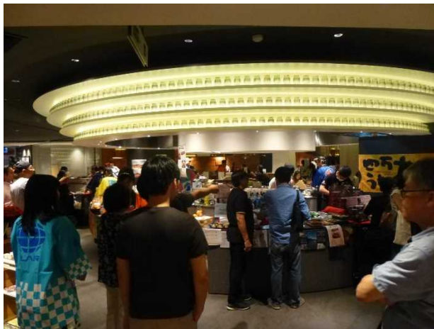
平成 29 年度 食品展会場の様子