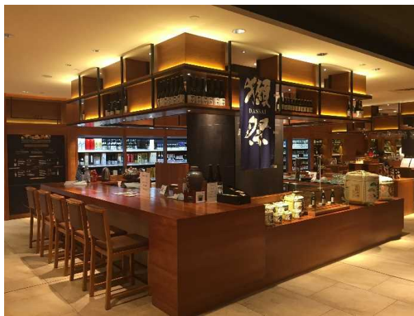
酒類提供エリア（予定）