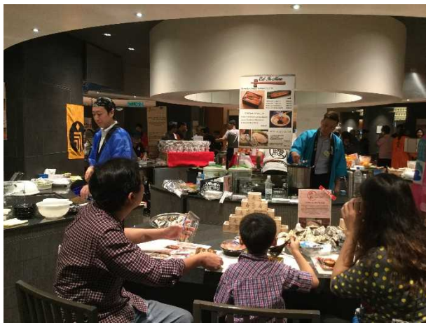
平成 29 年度 イートインの様子