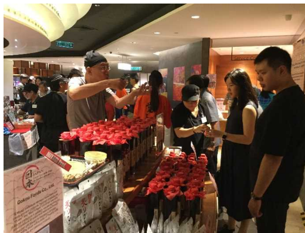
平成 29 年度 出展事業者による販売の様子